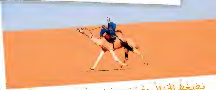
يَضَعُ الجِمالُ بِقَدَمَيْهِ عَلَى رَقَبَةِ حَيوانِهِ، كي يَحْتَنَهُ عَلَى التَّقَدُّمِ.

← لِفَتِ أَنْظارِ الشِّراةِ، قُلِبَسُ الجِمالِ أحيانًا حُللاً تَحَلَّلِ الأُميراتِ!